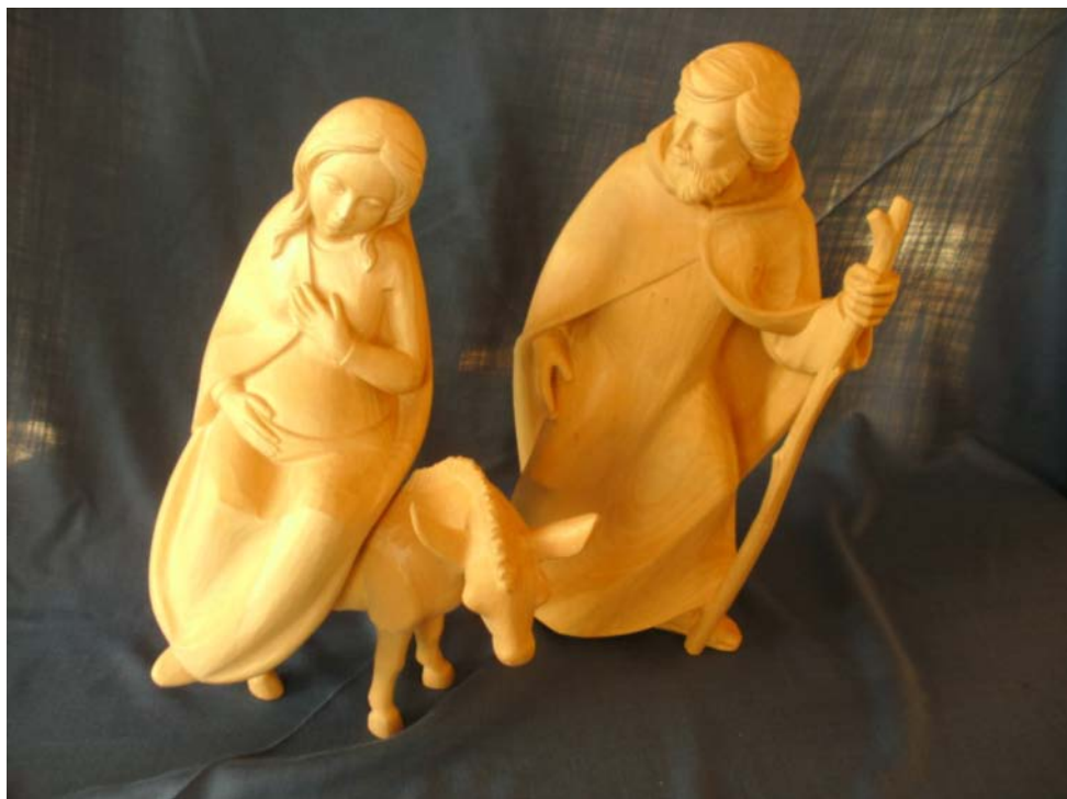
Foto: Herbergssuche, Szene aus der Weihnachtsskulptur der Stadtkirche, (Boysen)

Markusgemeinde Tel. 92490 · Lukaskirche Tel. 4714 Dezember 2011 bis Februar 2012