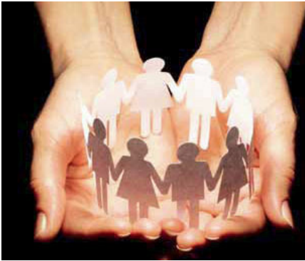
Gemeinsames Teilen zeichnet Mission in Solidarität aus

„Wir sind auf dem Weg zu einer internationalen ökumenischen Gemeinschaft von Kirchen und Missionsgesellschaften, in der wir unsere Hoffnung auf das Reich Gottes miteinander teilen“ heißt es in der Theologischen Orientierung des EMS. 2012 feiert das E vangeli s che M issions w erk in S üdwestde u t s ch l and sein 40jähriges Bestehen. 23 Kirchen und 5 Missionsgesellschaften in zehn Ländern in Asien, Afrika, dem Nahen Osten und