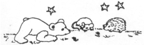
Bären-, Mäuse-, Igel- und Sternchengruppe

Wir wollen aus unserem Martin-Luther-Kinderhaus von einem wirklich rundum gelungenen Nachmittag berichten: